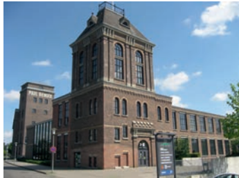
Ehemalige Spinnerei Bendix dient heute als Gymnasium

2 Die Spinnerei & Weberei Paul Bendix in schöner Gründerzeitarchitektur wurde im Jahr 1824 als Familienunternehmen der Textilin-