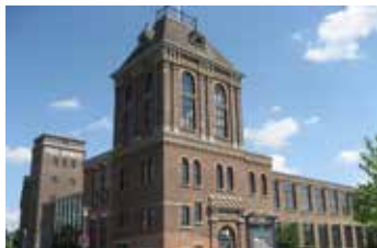
Ehemalige Spinnerei Bendix dient heute als Gymnasium

2 Die Spinnerei & Weberei Paul Bendix in schöner Gründerzeitarchitektur wurde im Jahr 1824 als Familienunternehmen der Textilindustrie gegründet. Erst nach fünf Generationen wurde der Betrieb 1993 aufgegeben. Heute wird das Gebäude als Gymnasium und Jugendzentrum genutzt.