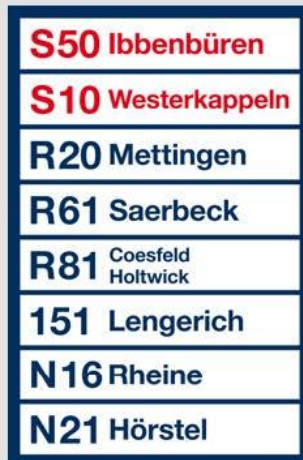
Vermaßung der Haltestellenfahne „WVG-Kompakt“