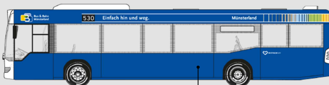
Im Bereich unterhalb der Fenster können Bildmotive oder Texte positioniert werden.