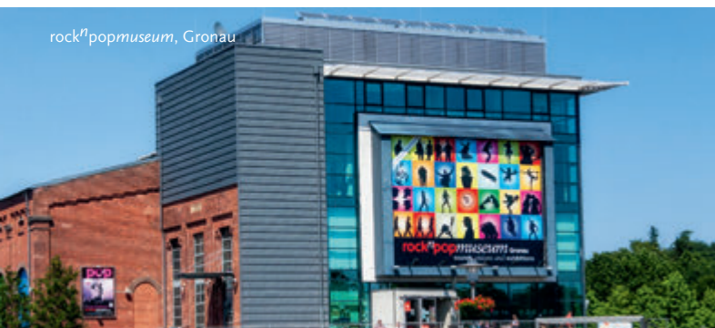
rock 2 popmuseum, Gronau

Für Ihre Tagesausflüge sind die 9 Uhr TagesTickets 1 Person ideal und immer günstiger als Einzeltickets für die Hin- und Rückfahrt. Es können bis zu drei Kinder unter 14 Jahre oder das Fahrrad mitgenommen werden.