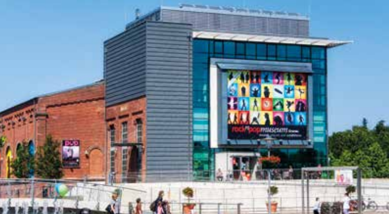
Rock und Pop Museum

Dabei werden Sie feststellen, dass Bus- und Bahnfahren in den letzten Jahren deutlich an Qualität gewonnen hat und viel einfacher geworden ist. Sind Sie 60 Jahre oder älter bieten Ihnen die Verkehrsunternehmen im Münsterland ein einfaches Ticket-Angebot, das genau auf Ihre Bedürfnisse zugeschnitten ist. Ganz gleich ob Sie nur gelegentlich fahren oder täglich, es gibt für jeden Weg ein passendes Ticket.